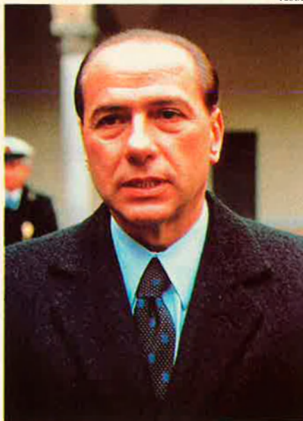
Berlusconi. Vol recuperar el poder.

Caigut Berlusconi del govern, els destins d'Itàlia es troben ara en mans d'un