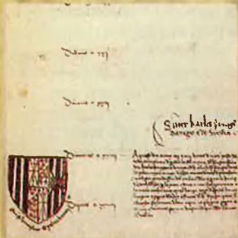
Escut d'armes de Carles da Viana. La llegenda "Qui se humiliat exaltabitur" correspon a la notícia de la seva mort.