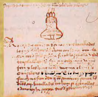
Campana anomenada "seny de les hores". De la Seu.