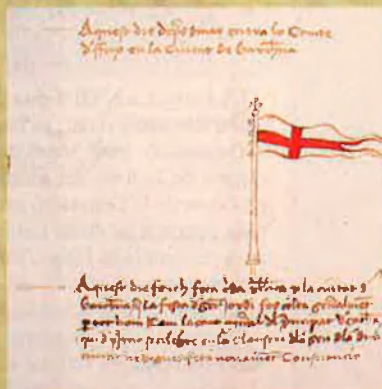
Bandera de sant Jordi que encapçala la nota de l'obligació de celebrar la festa. La Cort General en va fer una constitució.

"Dijous, a II. Jueus. Aquest dia entraren e surgiren en la plaja de Barchinona una gran nau de Rodes de II mil D botes e una galeassa grossa de Ffrança, e VIII entre nauetes e galeons, totes carreguades de jueus, qui exien de Aragó, de València e de Cathalunya, e eren-se enbarchats part en Tortosa e part en Terragona, exints de dites terres per manament de la majestat del senyor rey. Restaren-ne en Barchinona circa de XX, qui-s faheren cristians; los altres, ab dites fustes, se'n anaren la via de levant, e entre tots eren passats deu mil jueus entre hòmens, dones e infants."