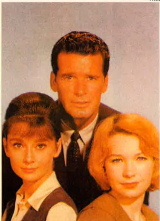
James Garner entre Shirley McLaine i Audrey Hepburn en l'adaptació al cinema de 'The Children's Hour'. William Wyler va adaptar dues vegades aquesta novel·la davant l'obligació de suprimir les connotacions lèsbiques de la història.

Un exemple recent del temor que ha inspirat fins ara l'homosexualitat femenina a Hollywood és el de la popular Tomàquets verds fregits , de John Avnet, inspirada en la novel·la del mateix títol de Fannie Flag. La relació clarament homosexual de les dues