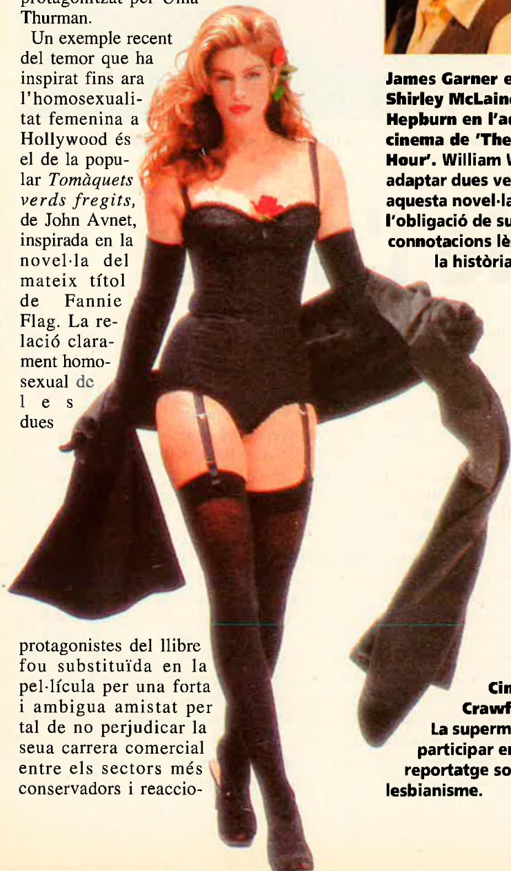
Cindy Crawford. La supermodel va participar en un reportatge sobre el lesbianisme.