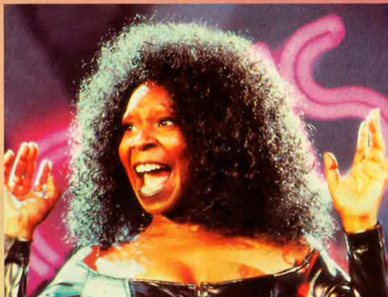
Glose, Goldberg i Streisand. Els rostres de l'alliberament lèsbic en el cinema.