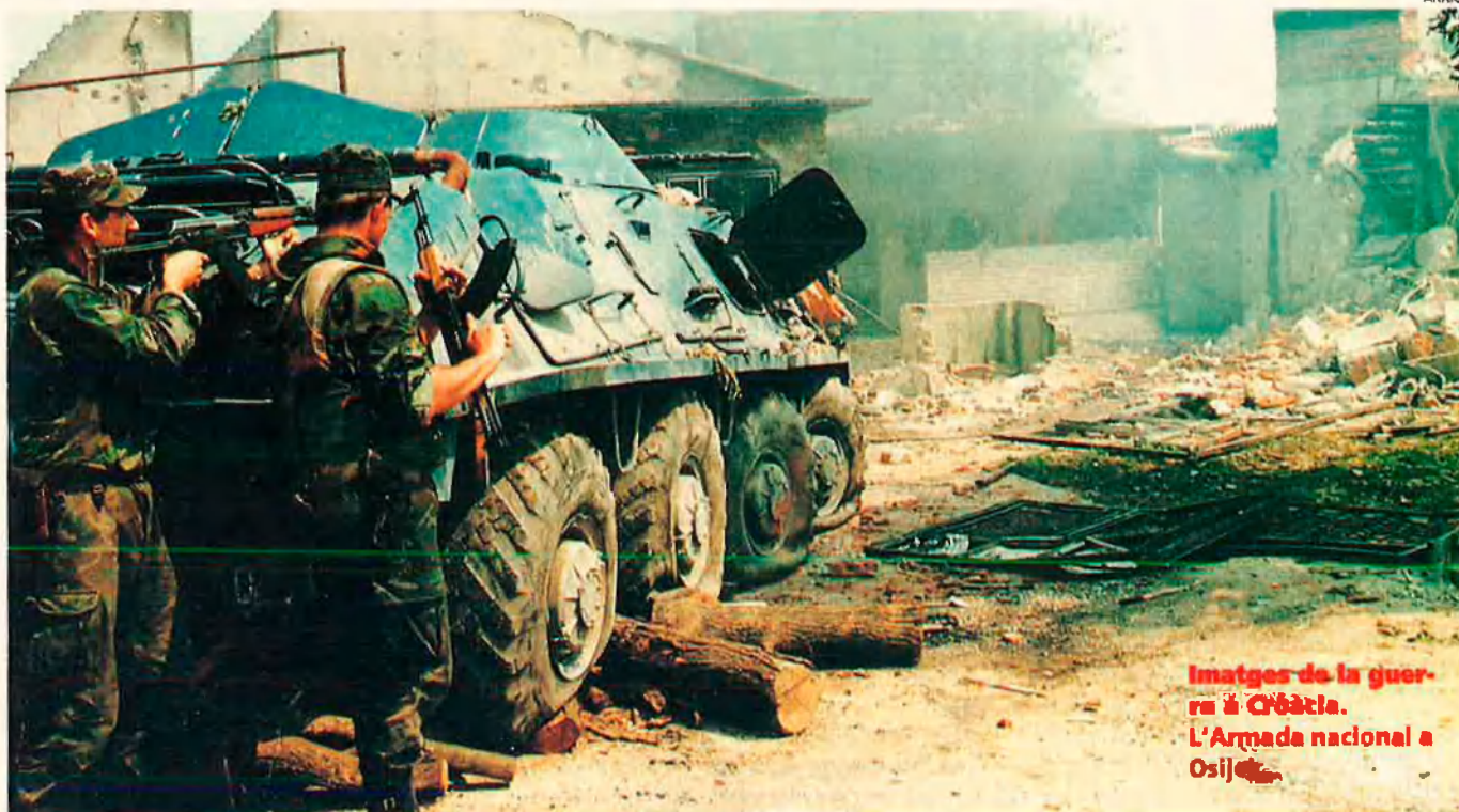
Imatges de la guerra a Cròàtia. L'Armada nacional a Osijek.