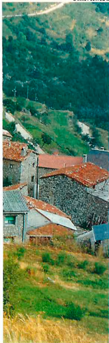
El port de Claror, a Arànsers (en la imatge) era un dels punts de pas tradicionals del contraban dels anys quaranta i cinquanta. Llavors les mercaderies havien de ser transportades a peu, afrontant a les inclemències del temps.

bosc, fins que va arribar un altre a recollir-la. Amb una grua van treure el cotxe i li van donar rodes noves perquè pogués reprendre el camí. Quatre dies després el jove es va presentar al poble per tornar-los les rodes i agrair-los l'ajut.