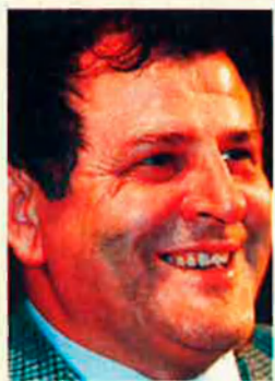
Vladimír Mečiar. A la taula de ministres del règim eslovac hi ha comunistes i ultranacionalistes a canvi del seu suport.

La mateixa por tenen, i alhora se'n beneficien, els governs d'Eslovàquia i de Romania. Els dos milions d'hongaresos de Transilvània són presentats per l'extrema dreta com una amenaça per la integritat de Romania, com a virtuals