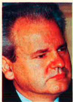
Milosevic. Sèrbia manté relacions amb la Rússia de Ieltsin que podrien donar certs acords econòmics.

"agents" al servei d'interessos estrangers. I així Romania, agermanada històricament amb Rússia i Sèrbia, no pas pels vincles eslaus, però sí pels de la religió ortodoxa, ha reconvertit la seva "revolució" del desembre del 89 en un règim on l'ex-comunista Ion Iliescu conserva el poder gràcies al suport de l'extrema dreta nacionalista i dels sectors estalinistes, tots plegats antihongaresos. La política exterior romanesa està hipotecada pels "socis" d'Iliescu, que ha arribat a exigir el canvi de militars reformistes per d'altres de "patriòtics" i a qüestionar l'entrada a l'OTAN, arrenglant-se amb posicions russes.