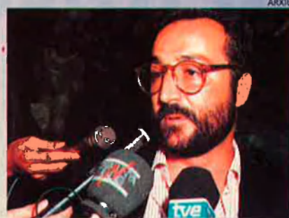
El governador civil de Girona. Creu que s'ha de seguir, per prudència, el moviment de capitals russos.

—És veritat, cert, que es parla d'inversions productives. També és cert que hi ha molta confusió, els empresaris tenen molta experiència i són prudents.