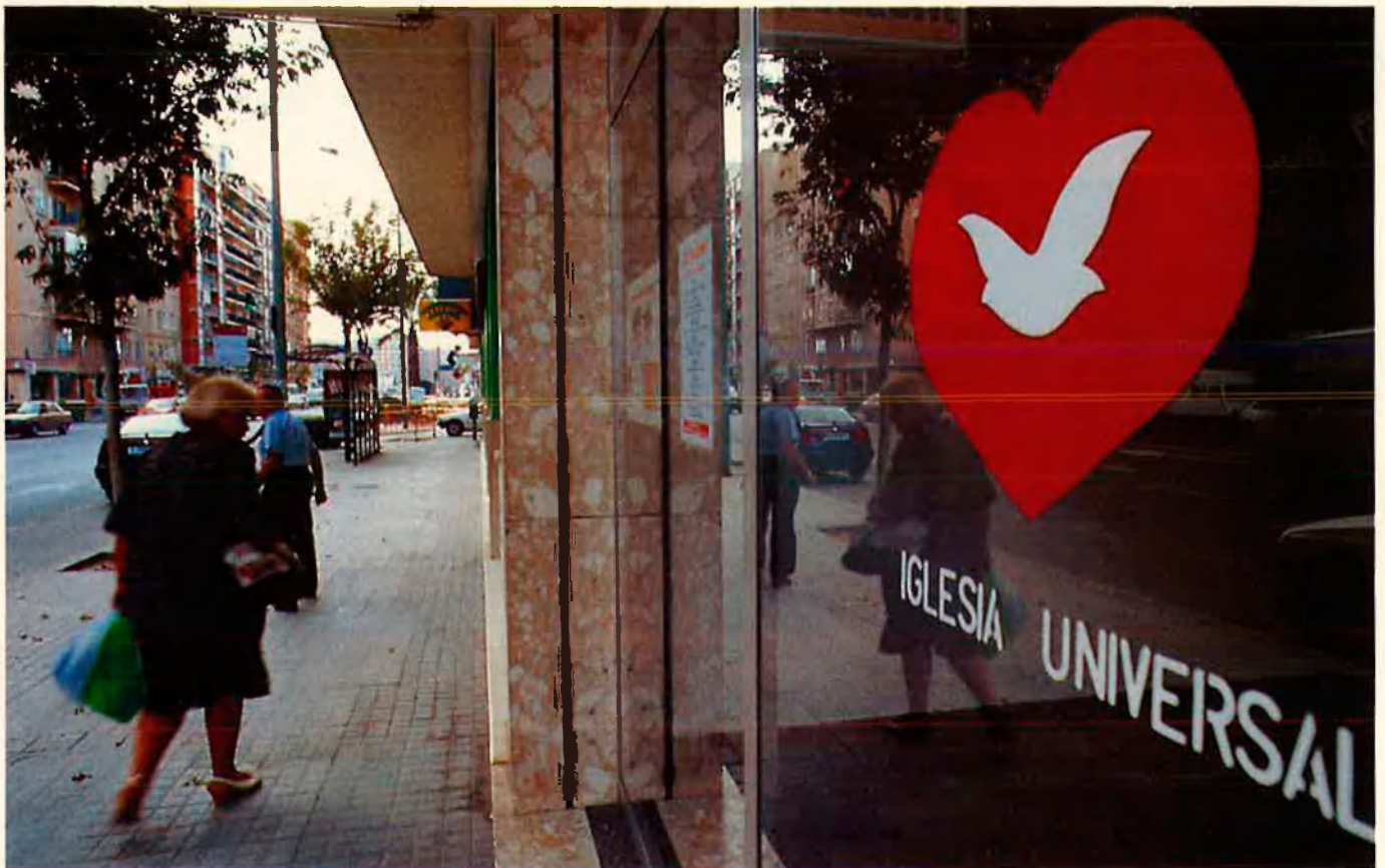
La secta acaba d'instal·lar-se a Barcelona i a València. El local de València, a l'avinguda de Peris i Valero, amb els símbols de la Iglesia Universal del Reino de Dios, el colom i el cor.