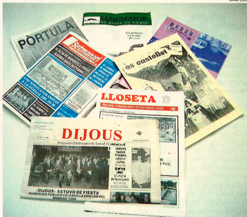
L'APFM reuneix 51 capçaleres de 37 municipis. Més del 60% de la població mallorquina llegeix aquestes revistes.