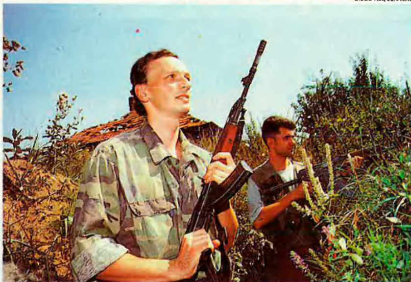
Sarajevo ha viscut l'enfrontament des de tots els costats. Els boscos del voltant (foto) han estat un preciós escenari per a morir.

2 agost. Eleccions a Croàcia: Franjo Tudjman és reelegit president amb el 56,7% dels vots.