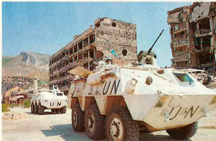
Els cascos blaus de l'ONU han vist qüestionada la seva actuació. En molts casos han estat uns simples garants de territoris ocupats.