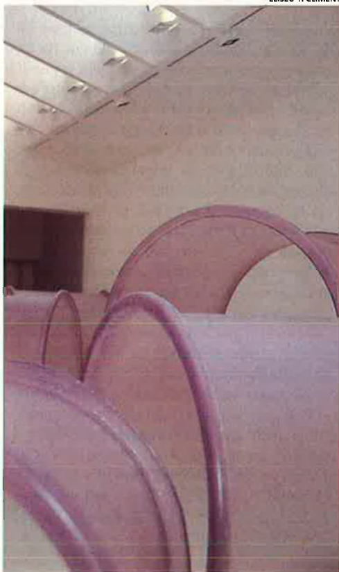
Museu d'Art Modern. Actualment, l'art, a Ceret, viu en la incògnita de l'empenya o l'alentiment.