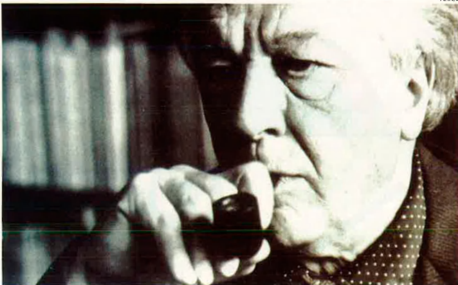
André Breton. Imatge del creador surrealista al seu estudi el 1960.

bella, misteriosament màgica. Mentre l'una recreava el món interior amb imatges verbals, l'altra ho feia amb procediments formals. I totes dues obrien una estreta correspondència poemàtica. Constellations és un exemple de vint-i-dos textos automàtics de Breton a partir de les sensacions de vint-i-dues aigües de Miró.