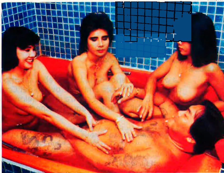
Pobles sencers de Tailàndia i Filipines han estat transformats en centres turístics dedicats a la prostitució. A Tailàndia es paguen 6.000 pessetes per una nena verge.