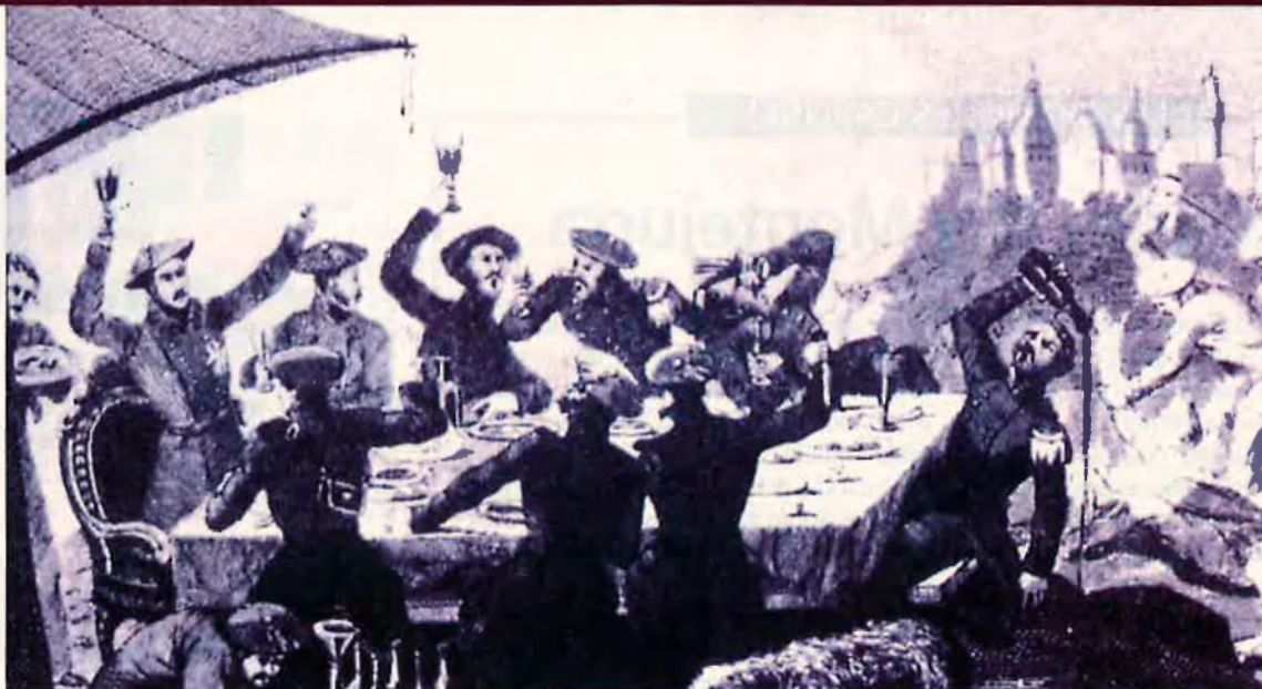
Dalt, festí de Cabrera i els generals carlins, després de conquerir Burjassot. Baix, a l'esquerra, imatge de Berga el 1840, ocupada pels carlins. A la dreta, el general Ramon Cabrera, sobre qui Joan Fuster escrigué en el seu dietari (vegeu p. 53).

progressat realment. Aquest és l'únic que ha aprovat els seus estatuts i està registrat com a partit diferenciat. El Partit Carlí de Catalunya no s'ha "legalitzat" encara, tot i que els seus impulsors anuncien que ho faran abans d'acabar aquest any. A les Balears, els carlins estan menys organitzats.