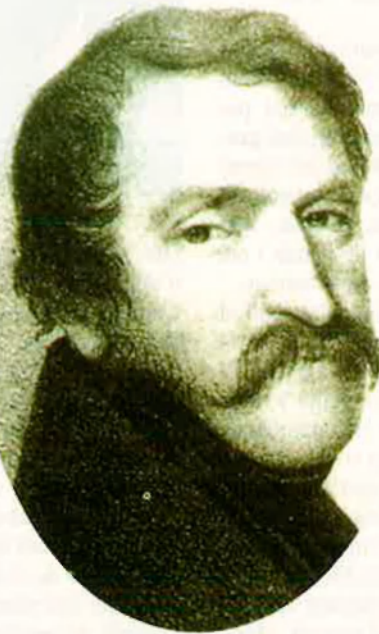
Carlos María Isidro de Borbón. Va ser el primer pretendent del carlisme.

xecament militar de 1936 i la posterior "traïció" de Franco. Novament el carlisme s'escindiria en l'extrema dreta, que continuaria al costat del dictador, i l'esquerra,