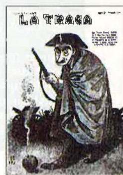
Portada de 'La Traca'. Apareix com "Sant Miguel Maura, Patró de la Guàrdia Civil".