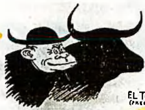
EL TORO (PRECISAM)