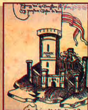
Castell de Montcada.