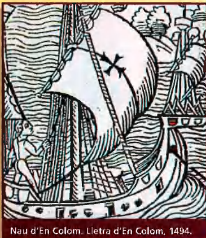
Nau d'En Colom. Lletre d'En Colom, 1494.