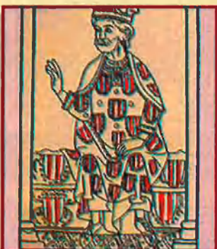
Jaume I, s. XIII. 'Càntigas de Santa Maria'.