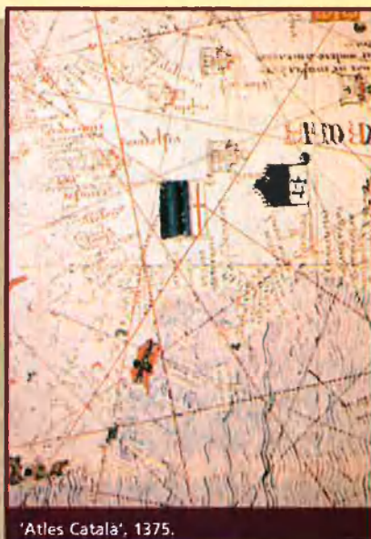
'Atles Català', 1375.