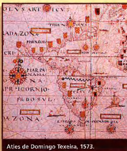
Atlas de Domingo Texeira, 1573.

catalana d'Amèrica no podríem fer mai sentit de la presència de les barres catalanes al port de partença de l'expedició, a la nau d'En Colom, a les tres caravel·les, però, sobretot, tampoc no podríem explicar la seva presència a les cartes nàutiques, atles i mapamundis que els cosmògrafs hispans i internacionals pintaran a les noves terres americanes com a senyal de possessió territorial. En aquest sentit no és estrany que trobem l'ensena catalana en els mapes més primitius del continent americà com el Mapa d'En Cantino, del 1502; el d'En Bernardo Silvanus, del 1511; l'atribuït a En Jorge Reinel, del 1518; l'Atlas Müller, del 1519; el Mapa d'En Verrazzano, del 1529; o els posteriors d'En Guillaume Le Testu, del 1556; el d'En Diogo Homem, del 1558; el de l'Andreas Homem, del 1559; l'impressionant Atlas d'En Domingo Texeira, del 1573; les il·lustracions de Le Fameux Voyage aux Indes Occidentales , d'En Baptista Boazio, del 1588; un planisferi portuguès anònim del 1590, el d'En Pierre de Oulx, del 1613; el d'En Joan Oliva, del 1614 o el Mapa d'En Sebastiano Lopes, del 1656.