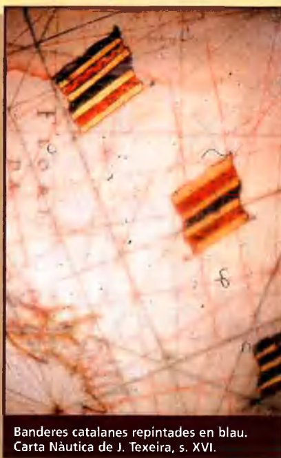
Banderes catalanes repintades en blau. Carta Nàutica de J. Texeira, s. XVI.