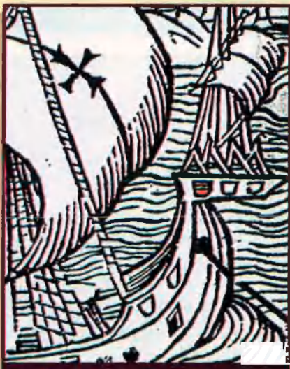
Nau d'En Colom. Lletra d'En Colom. 1494.