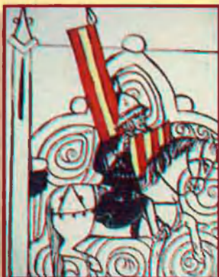
Soldat Català. Llibre de Coronacions dels Reis d'Aragó, s. XIV