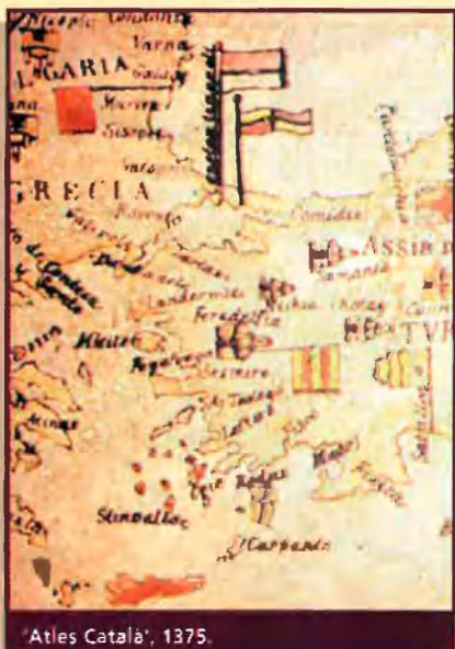
'Atles Català', 1375.