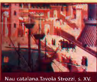
Nau catalana. Tavola Strozzi, s. XV.