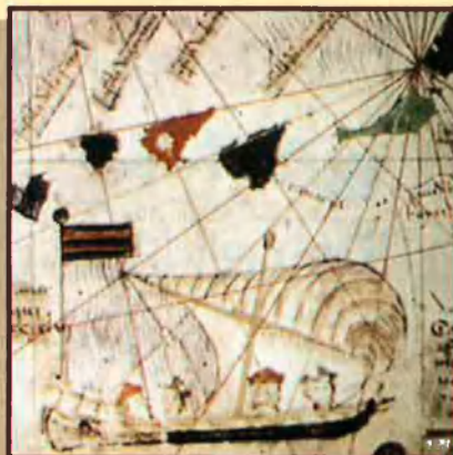
Nau d'En Jaume Ferrer. 'Atles Català', 1375.