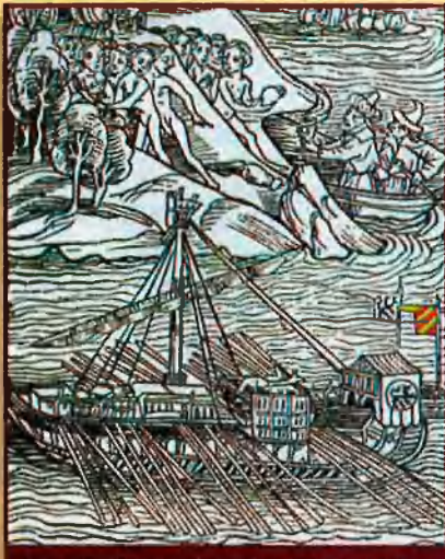
Nau d'En Colom. Lletre d'En Colom, 1494.