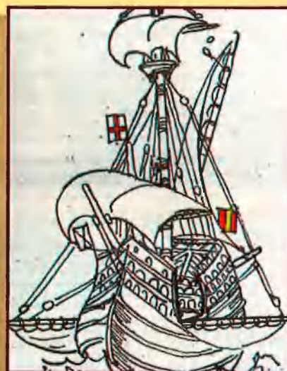
Nau d'en Colom. Carta portuguesa de l'Ocea Indic, vers 1510.