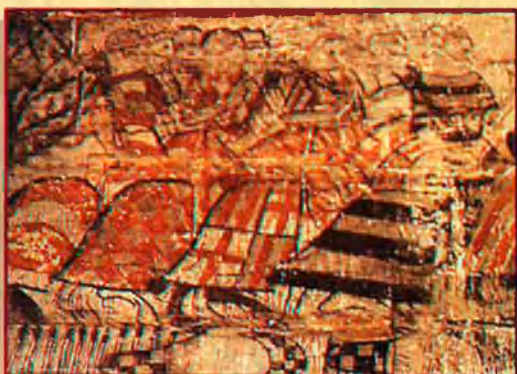
Cavalleria catalana. Castell d'Alcanyis. Mural, s. XIV.