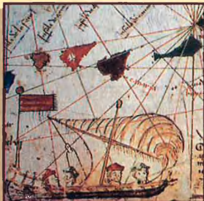
Nau d'En Jaume Ferrer. 'Atles Català', 1375.