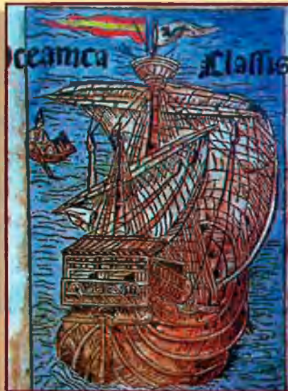
Nau d'En Colom. Lletre d'En Colom, 1494.