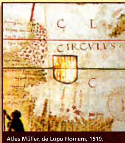
Atlas Müller, de Lopo Homem, 1519.