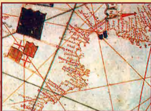
Portolà d'En Vallseca, 1439.