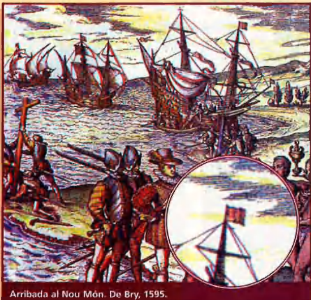
Arribada al Nou Món. De Bry, 1595.