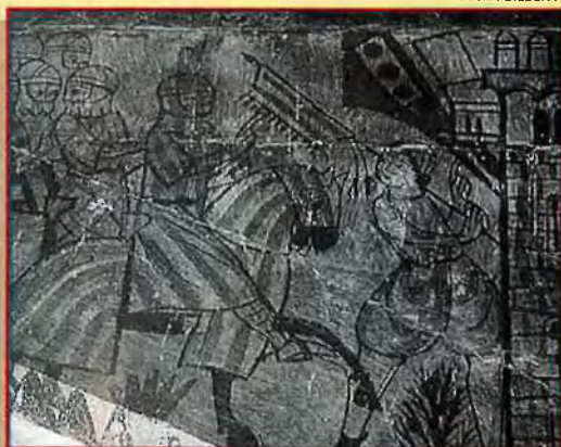
Exèrcit català. Castell d'Alcanyis. Mural, s. XIV.