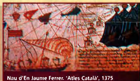
Nau d'En Jaume Ferrer. 'Atlas Català', 1375