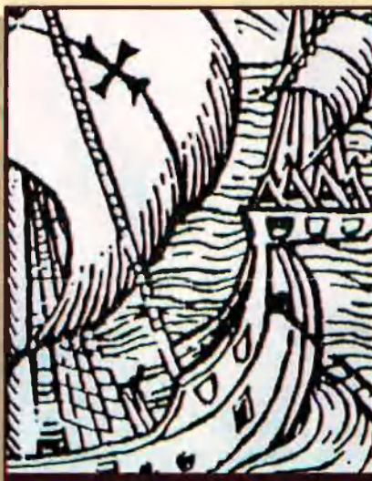
Nau d'En Colom. Lletra d'En Colom. 1494.