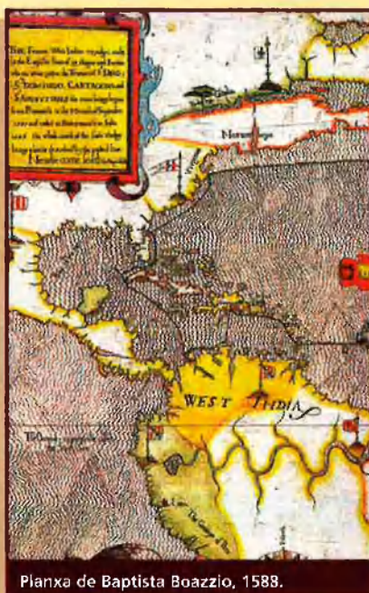
Planxa de Baptista Boazio, 1588.