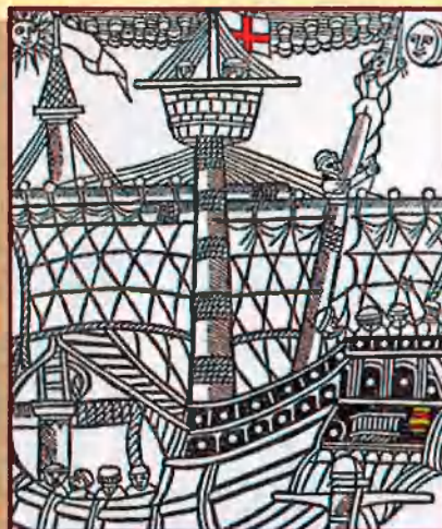
Arribada a les Índies. Incunable Biblioteca Nacional de París, 1494.