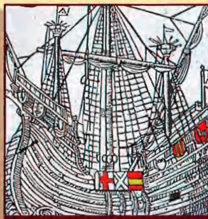
Nau atribuïda a En Colom, s. XVI.

de Castella. I, per tant, la bandera reial que desplega En Colom només pot ser la bandera catalana. I la segona prova és un fragment de la Història General de les Índies i Conquesta de Mèxic , del pseudo López de Gómara, que fa: “Va dir que el Sant Pare de Roma [Alexandre VI] vicari de Jesucrist a tota la rodonesa de la terra, que tenia poder absolut sobre les ànimes i la religió, havia donat aquelles terres [és a dir, les Índies] al molt poderós rei de Castella, el seu senyor”. El text, a més a més de ser fals, ens demostra la imperícia del censor, car si Alexandre VI, com a català que fou, tingué mai un senyor rei, del qual fou súbdit, aquest no podia ser cap altre que el rei d'Aragó.