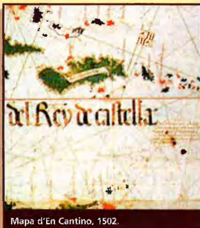
Mapa d'En Cantino, 1502.