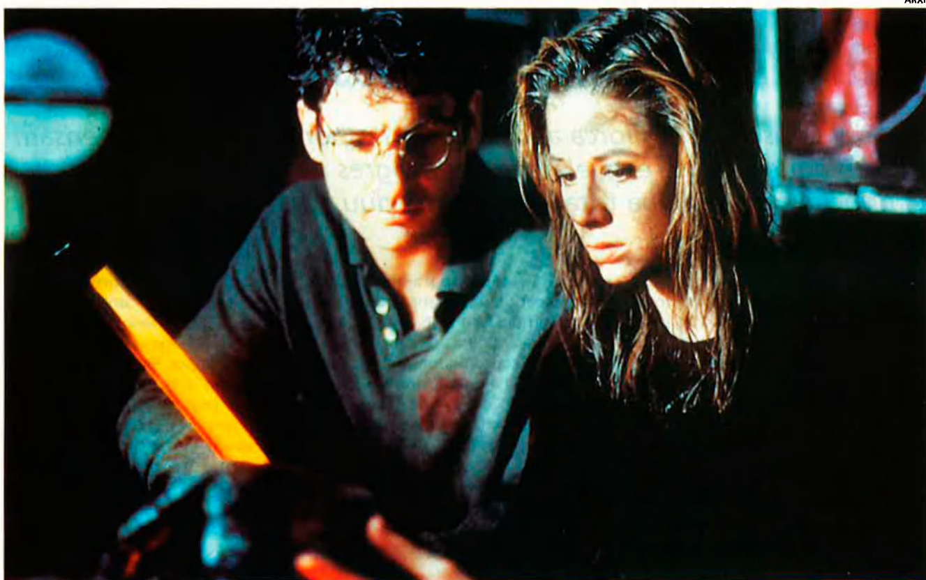
Mira Sorvino protagonitza 'Mimic'. Aquesta pel·lícula farà saltar els espectadors de la butaca el dia de la inauguració.

retrospectiva de José Mojica Marins, que havia estat programada per l'edició de l'any passat però es va haver d'ajornar per problemes tècnics. Aquest any, es mostra una selecció de la filmografia del director brasiler, un autor de culte dins del cinema de terror. També es presenta una selecció molt completa de l'obra de Karel Zeman, el director i animador txec que es caracteritza per uns efectes especials molt acurats. A més, es dedica un espai a Guy Maddin, un innovador director canadenc que ha esdevingut un dels més prometedors dins el panorama del cinema fantàstic. I per últim, s'ha volgut incloure un petit homenatge a Charles Band, el creador de Dolls , aquelles nines assassines que van espantar els nens i els seus pares. La crítica també té un paper important en el Festival. Una secció habitual és "Seven Chances", en què es projecten set descobriments de la crítica que només es podran veure al certamen. Seguint aquesta