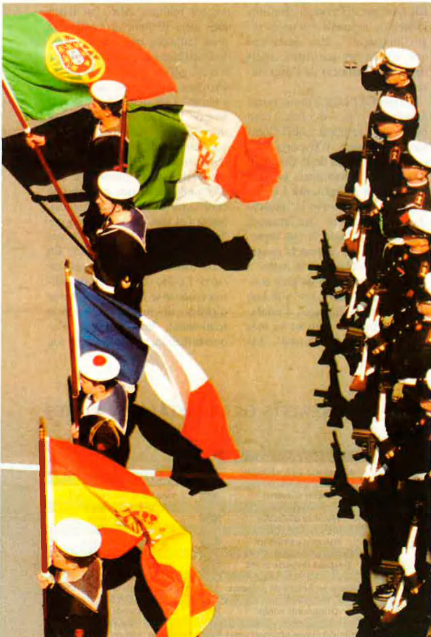
Les organitzacions militars europees i internacionals adquireixen cada cop més importància. L'exèrcit professional espanyol ho tindrà en compte.

sumpte, ja que "la UEO és una organització fora del control del Parlament europeu i dels consells de ministres", i està decidint sobretot un seguit de temes de defensa "que després passaran a la UE al marge de qualsevol debat parlamentari".