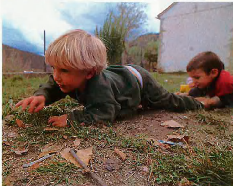
La canalla de Tirvia. En aquesta escola els pares s'han organitzat i cada setmana una família fa el dinar pels dos nens que no són del poble i que s'hi queden a dinar.