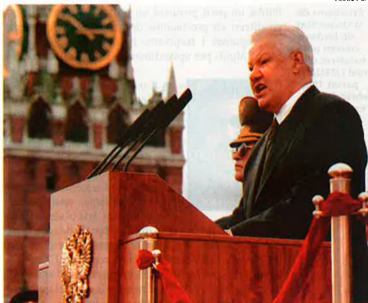
Borís Ieltsin, en un discurs el passat 9 de maig: "He estat testimoni de l'ascens i la decadència del primer tsar del postcomunisme", explica Libert Ferri

A quell dia, acabat d'arribar a París, vaig començar a entendre de debò què volia dir ocupar una plaça de corresponsal: intentar ser competent fins i tot en qüestions a les quals mai no s'havia prestat el menor interès. Aquesta falsa especialització en la no-especialització que constitueix el paradigma de la caricatura del periodista, però centrada en un àmbit geogràfic concret. En el cas de París, des de campanyes electorals fins a desfilades de moda; des d'escàndols polític-financers fins a biografies d'urgència de personalitats desaparegudes sobtadament; des del seguiment de les infraestructures que han d'unir França, Catalu-