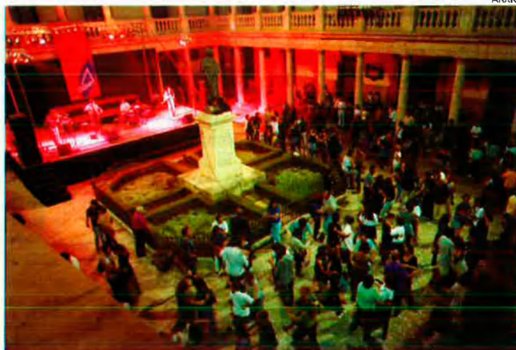
Festa de 'La Nau dels estudiants' al claustre de l'antiga Universitat de València. Setembre de 1997.

Calàbria, Bayer i Guerricabeitia. Escales amunt i arribats al claustre superior, s'endevina des d'uns finestrals l'anomenada sala del duc de Calàbria que mostra, ben protegida en vitrines, la col·lecció de còdexs, la part fonamental de la qual consta de llibres