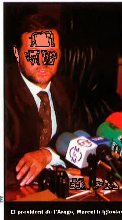
El president de l'Aragó, Marcel·lí Iglesias