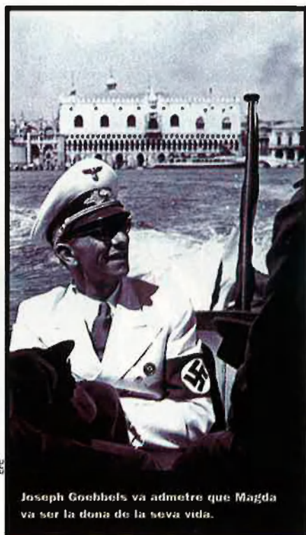
Joseph Goebbels va admetre que Magda va ser la dona de la seva vida.