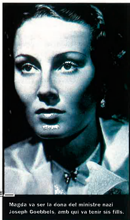
Magda va ser la dona del ministre nazi Joseph Goebbels, amb qui va tenir sis fills.