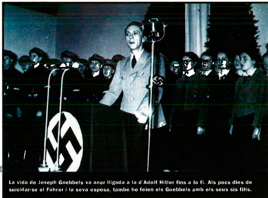
La vida de Joseph Goebbels va anar lligada a la d'Adolf Hitler fins a la fi. Als pocs dies de suïcidar-se el Führer i la seva esposa, també ho feien els Goebbels amb els seus sis fills.