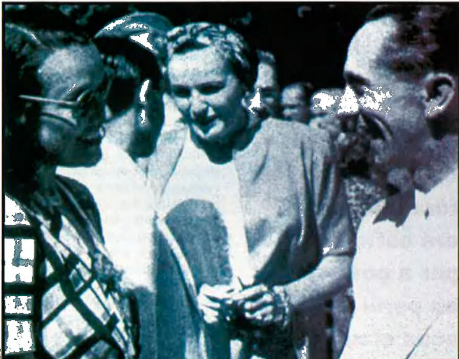
D'esquerra a dreta, l'actriu txeca Lida Baarova, una amant de Goebbels que va morir ara fa mig any, i el matrimoni Magda i Joseph Goebbels.

en nombroses referències, significa una experiència sexual. Vist el seu poc èxit amb les dones, Goebbels n'estava ben orgullós”.