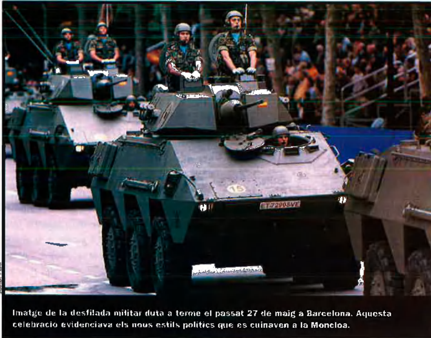
Imatge de la desfilada militar duta a terme el passat 27 de maig a Barcelona. Aquesta celebració evidenciava els nous estils polítics que es cuinaven a la Moncloa.