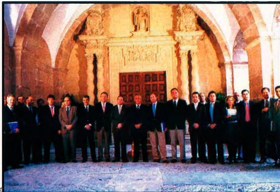
El "Manifiesto en defensa de las Humanidades" reunia al Monestir de San Millán de la Cogolla parlamentaris del PP de tot l'estat el passat 10 de juliol.

La majoria absoluta del PP ha tingut altres efectes més localitzats, com ara la pressió sobre el Pacte de Progrés que té el control del Govern de les Illes Balears i de tots els consells insulars. Jaume