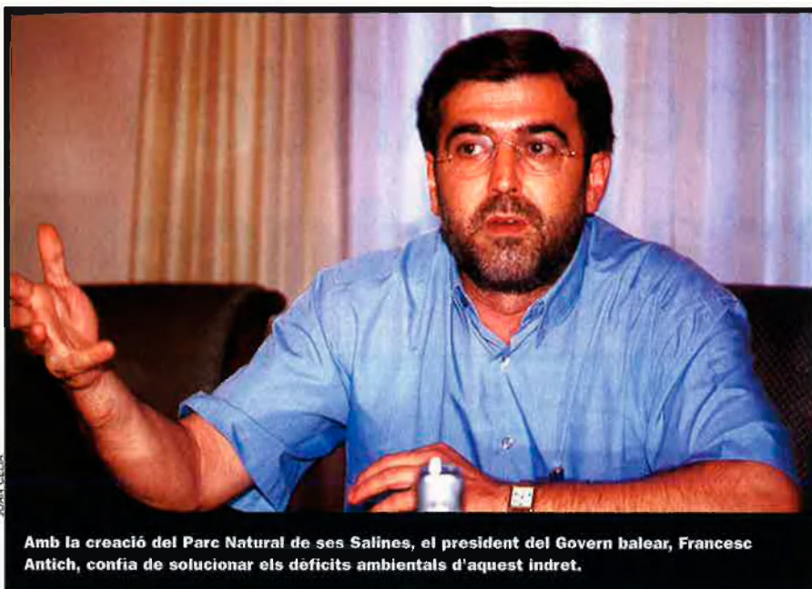
Amb la creació del Parc Natural de ses Salines, el president del Govern balear, Francesc Antich, confia de solucionar els déficits ambientals d'aquest indret.

En l'actualitat, les platges de ses Salines i es Cavallet, a Eivissa, i les d'Illetes i Llevant, a Formentera, són una de les destinacions principals d'aquestes dues illes. El fet que aquestes platges estiguin dins la Reserva Natural representa un problema ecològic, perquè segons els càlculs dels biòlegs del GEN i el GOB cada estiu entren a la Reserva més d'un milió de persones, la qual cosa és insostenible per a un espai tan fràgil. A això s'ha d'afegir el trànsit de vehicles i, sobretot, d'embarcacions. Només a la platja d'Illetes, de Formentera, es comptabilitzen fins a sis-centes embarcacions fondejades durant la temporada turística.