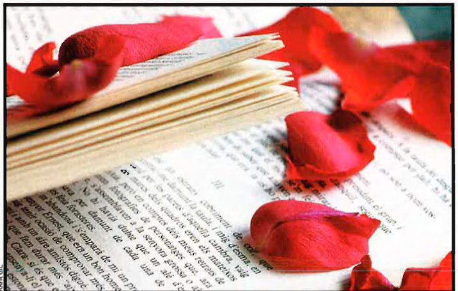
Les roses, però també els llibres, són el símbol tradicional i indiscutible de la diada de Sant Jordi.

Per Sant Jordi, les editorials del Principat abasteixen els lectors amb una allau de novetats. El nostre col·laborador, també Jordi, però Llavina, ens n'ofereix un tast perquè pugueu gaudir del plaer de llegir un bon llibre.