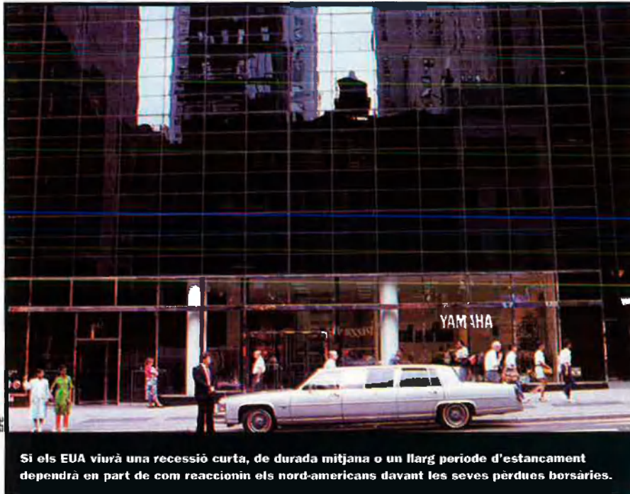
Si els EUA viurà una recessió curta, de durada mitjana o un llarg període d'estancament dependrà en part de com reaccionin els nord-americans davant les seves pèrdues borsàries.

El descens de l'índex NASDAQ en un 60% des del seu màxim històric el març del 2000 és equiparable en magnitud a l'esfondrament de la borsa entre 1929 i 1930