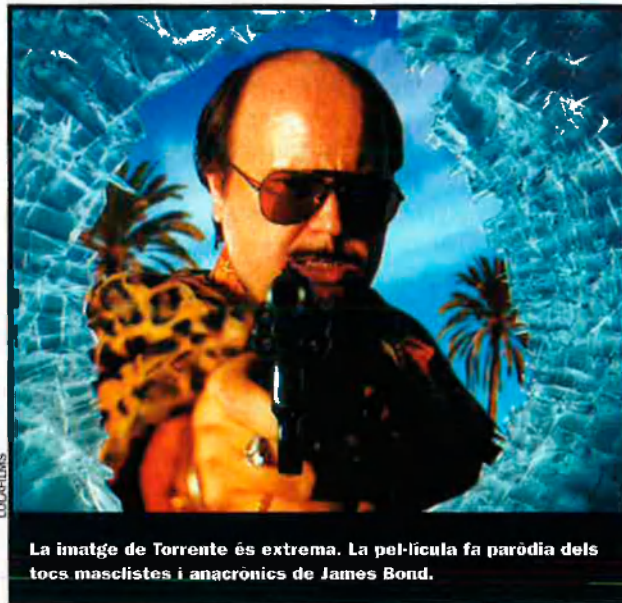
La imatge de Torrente és extrema. La pel·lícula fa paròdia dels tocs masculistes i anacrònics de James Bond.

—Marbella és una autèntica bogeria. Em sembla un lloc molt delirant, ple de diners, de iots, de xeics àrabs, de festes de famosos, de gent que