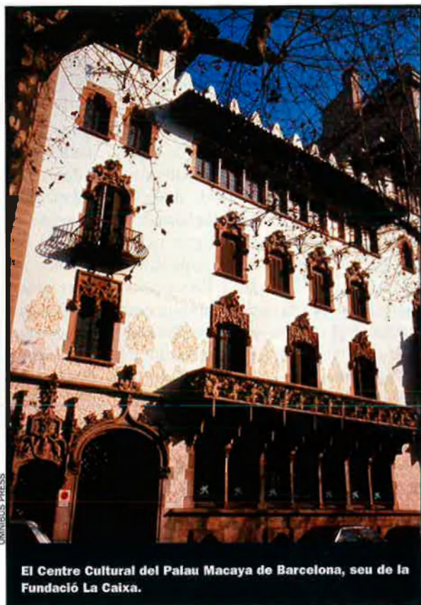
El Centre Cultural del Palau Macaya de Barcelona, seu de la Fundació La Caixa.

Segons l'AAVC, "la pretensió de La Caixa vulnera no només els drets d'autor dels artistes protegits dins del marc de la Constitució espanyola sinó que a més, donada la naturalesa de la pressió, condiona l'adquisició de les obres al fet d'obtenir, per la via de cessió, els drets econòmics que segons la Llei [Llei de Propietat Intel·lectual del 1987, text refós del 1992] només corresponen al seu autor o autora". I no seria una cosa d'abans d'ahir o un cas esporàdic, indi-