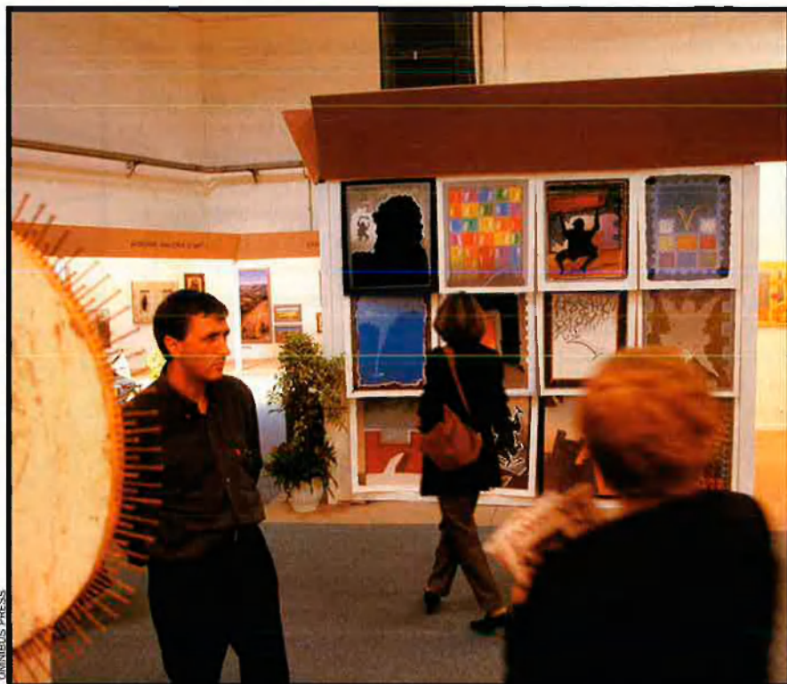
La Fira d'art de Barcelona, Artexpo, també és part implicada en la polèmica sobre els artistes. En la seva sisena edició, Artexpo ha establert un criteri de selecció molt rigorós.

La selecció, però, ja existia abans d'aquesta edició d'Artexpo. D'alguna manera. En edicions anteriors, un comitè