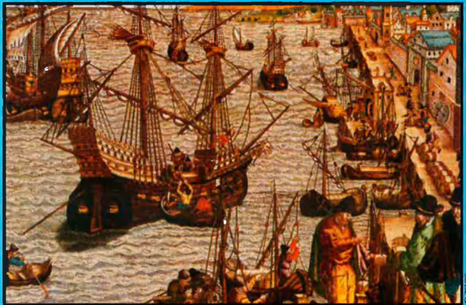
Portugal va ser una autèntica potència en el segle XVI. Els portuguesos van aconseguir una supremacia evident en la navegació, malgrat la modèstia demogràfica del país.

Els perills de l'ambició. Durant el segle XVIII, el portuguès Bernardo Gomes de Brito va publicar un obra que es faria molt popular al seu país: la Història tràgico-marítima . En realitat, ell no n'era l'autor ja que s'havia limitat a recopilar i retocar narracions anteriors –dels segles XVI i XVII– que fins a aquell