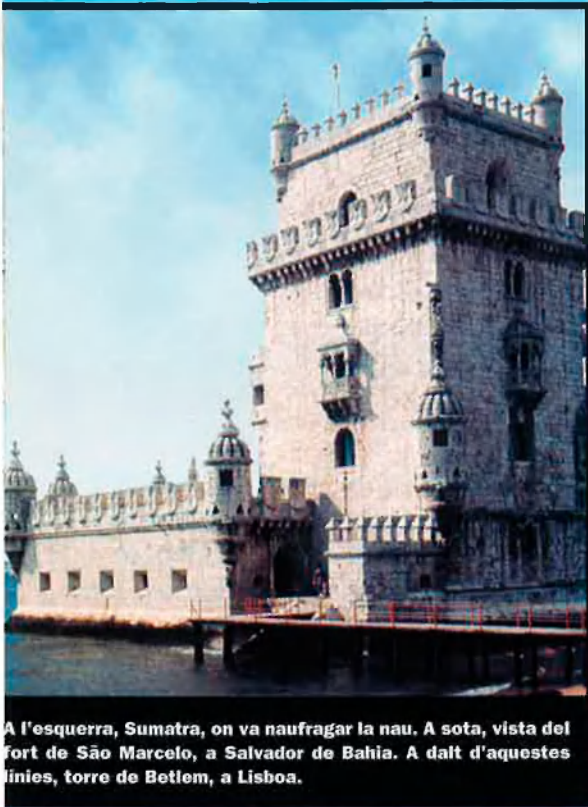
A l'esquerra, Sumatra, on va naufragar la nau. A sota, vista del fort de São Marcelo, a Salvador de Bahia. A dalt d'aquestes línies, torre de Belém, a Lisboa.