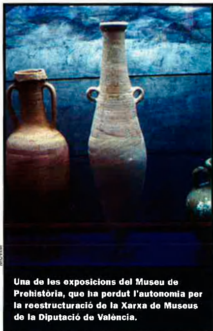
Una de les exposicions del Museu de Prehistòria, que ha perdut l'autonomia per la reestructuració de la Xarxa de Museus de la Diputació de València.