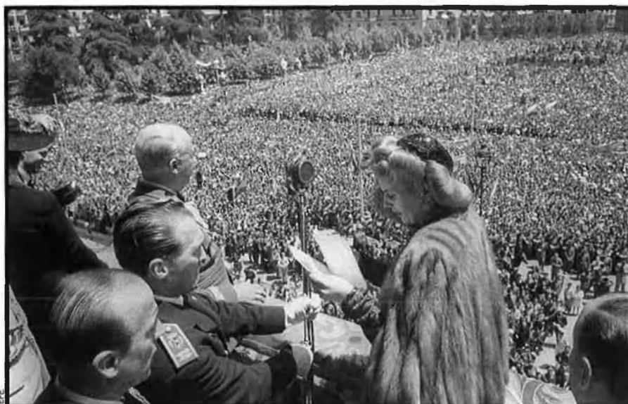
Eva Duarte de Perón, esposa del president d'Argentina, saluda la multitud des del balcó del palau de la Plaza de Oriente, a Madrid, en una visita a Franco el 1947.