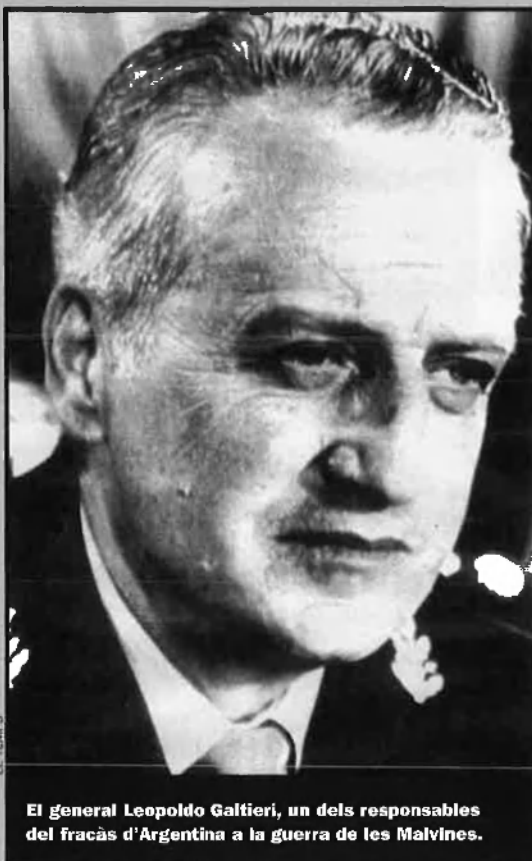
El general Leopoldo Galtieri, un dels responsables del fracàs d'Argentina a la guerra de les Malvinas.

A partir d'aquí l'Argentina va viure el seu període més llarg d'estabilitat política, tot i que es van produir un mínim de dos intents frustrats de revolució els anys 1893 i 1905. Va ser un període excepcional definit com els anys de "la llarga pau Argentina". A partir del 1930 es va confirmar que, certament, l'etapa anterior havia estat una excepció històrica. Van tornar les revoltes, les conspiracions de sang i fetge i el retorn al poder polític dels conservadors sota la influència decisiva de l'oligarquia financera de l'època. El 1943 s'inaugurà el poder del coronel Perón sota la presidència del general Ramírez, i dotze