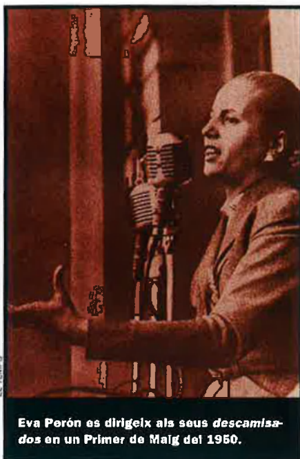
Eva Perón es dirigeix als seus descamisados en un Primer de Maig del 1950.

La crisi econòmica creixia al mateix ritme que les crisis institucionals i polítiques. L'Argentina no tenia estabilitat. A l'interior del peronisme, el llarg exili del líder creà la necessitat d'organitzar el partit sense Perón. Tots els sectors volien controlar l'aparell de decisió. Tots s'atorgaven el favor del mite. Tots deien que transmetien el que deia des de Ma-