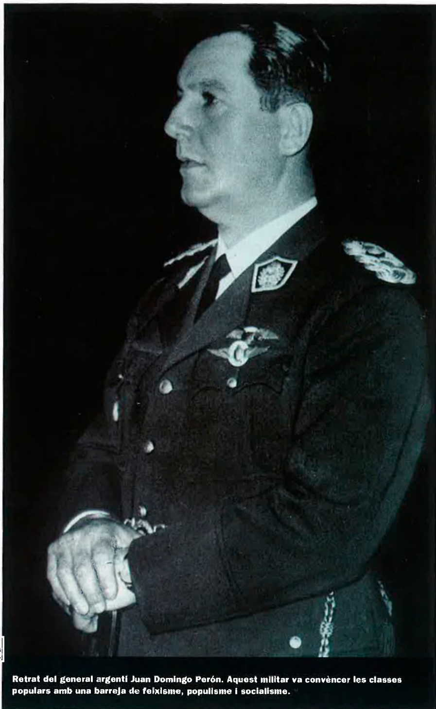
Retrat del general argentí Juan Domingo Perón. Aquest militar va convèncer les classes populars amb una barreja de feixisme, populisme i socialisme.

Perón era capaç en el mateix dia de presidir un acte sindical i inaugurar després una nova instal·lació militar