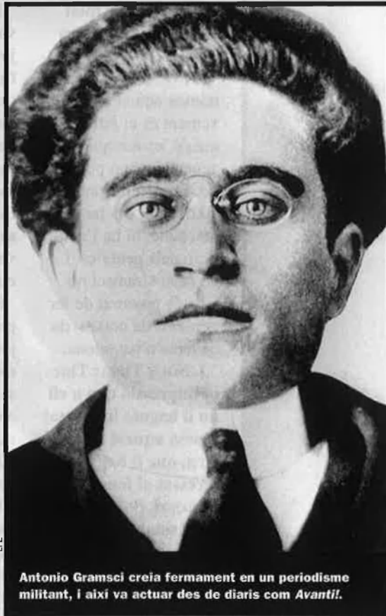
Antonio Gramsci creia fermament en un periodisme militant, i així va actuar des de diaris com Avanti! .

El 1911 va aconseguir una beca per anar a la Universitat de Torí, on estudià lingüística, humanitats, ciències socials i desenvolupà la seva activitat política en el si del Partit Socialista Italià (PSI). També va començar a destacar com a periodista, especialment en les seves