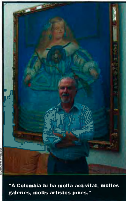
“A Colòmbia hi ha molta activitat, moltes galeries, molts artistes joves.”

“A Colòmbia s'ha assajat tot, de la mà dura a la tova, en tots els seus matisos. Ningú no ho ha aconseguit arreglar, ni tan sols en part”