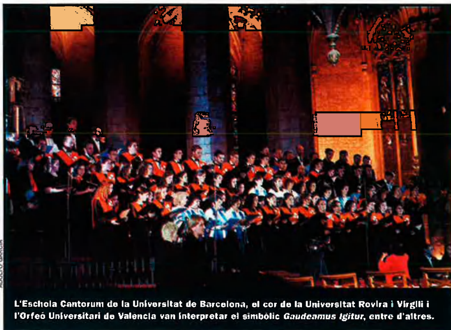
L'Eschola Cantorum de la Universitat de Barcelona, el cor de la Universitat Rovira i Virgili i l'Orfeó Universitari de València van interpretar el simbòlic Gaudeamus Igitur , entre d'altres.

l'ocasió— una part del repertori de peces de l'època d'Alexandre VI que la formació va publicar en una edició de dos compactes ara fa dos anys. Nunca fue pena mayor —amb composicions religioses— i Plaser y Gasajo —amb músiques profanes— són els dos treballs que recullen bona part de les composicions vinculades a la cort del papa Borja.