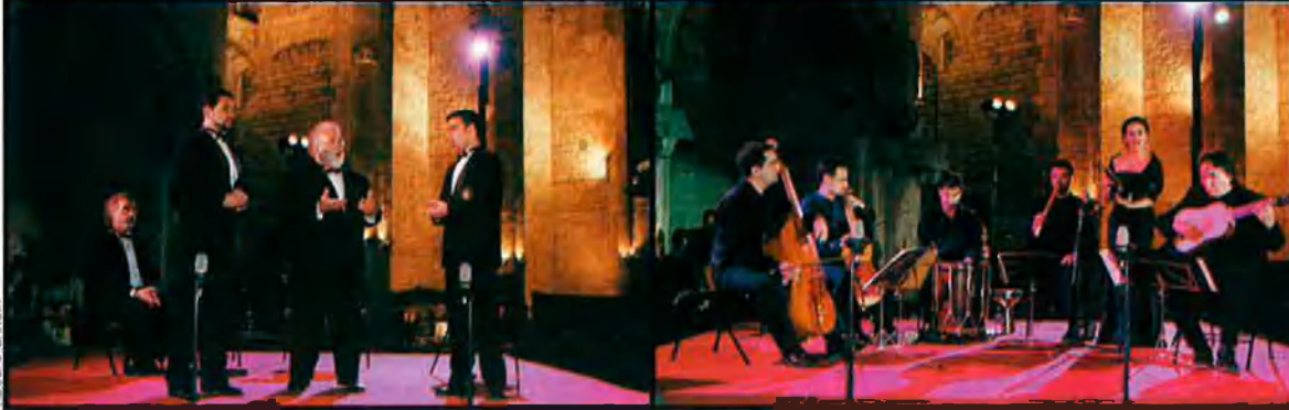
Dalt a l'esquerra, Vitoria Musicae, que va interpretar el "Cant de coronació" d'Alexandre VI, i, al costat, la partitura sobre la qual s'ha recreat l'obra. A sota, la capella del Misteri d'Elx i la Capella de Ministrers.