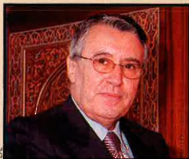
El ministre marroquí Benaissa ha estat convidat a Vinaixa.