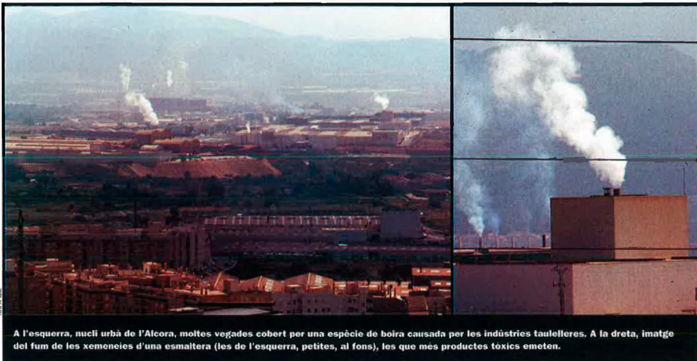
A l'esquerra, nucli urbà de l'Alcora, moltes vegades cobert per una espècie de boira causada per les indústries taulelleres. A la dreta, imatge del fum de les xemeneies d'una esmaltera (les de l'esquerra, petites, al fons), les que més productes tòxics emeten.