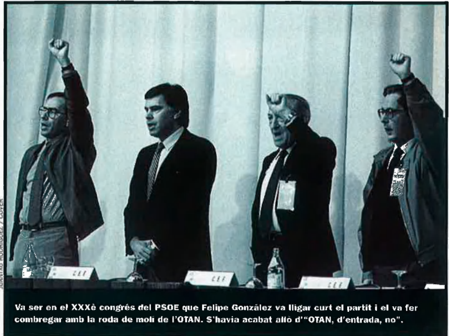
Va ser en el XXXè congrés del PSOE que Felipe González va lligar curt el partit i el va fer combregar amb la roda de moli de l'OTAN. S'havia acabat allò d'"OTAN, d'entrada, no".

Però no era això el que més preocupava al líder socialista. A banda del debat