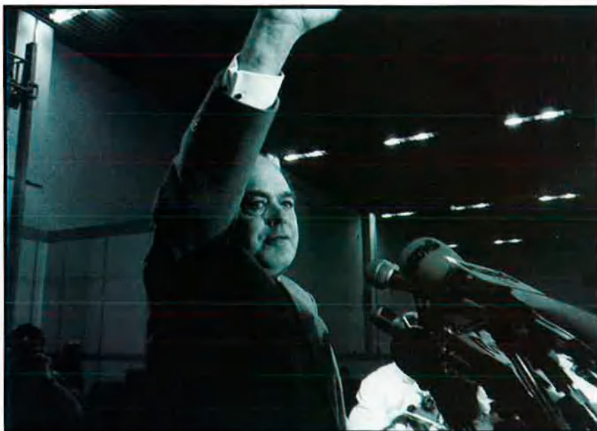
Pujol va ser protagonista per la seva contundent victòria a les eleccions autonòmiques, i Lerma ho va ser per oficialitzar l'himne i la senyera amb franja blava al País Valencià.