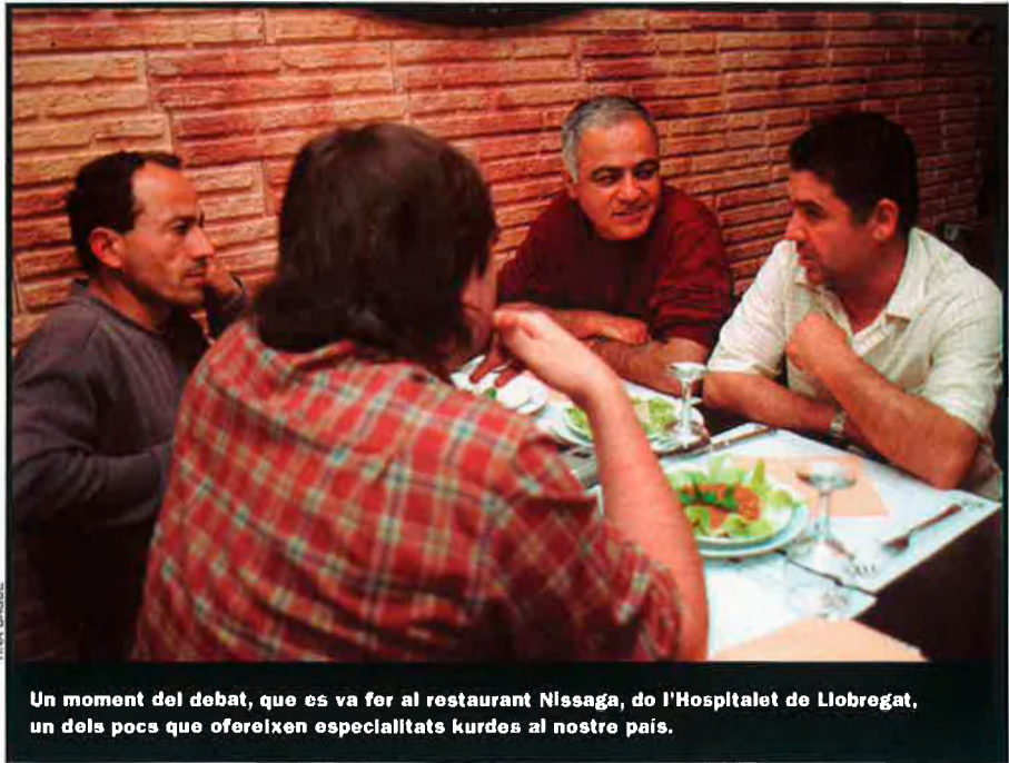
Un moment del debat, que es va fer al restaurant Nissaga, de l'Hospitalet de Llobregat, un dels pocs que ofereixen especialitats kurdes al nostre país.

R. BERTI: Jo crec que en principi sí. Perquè si el poble kurd ja estava