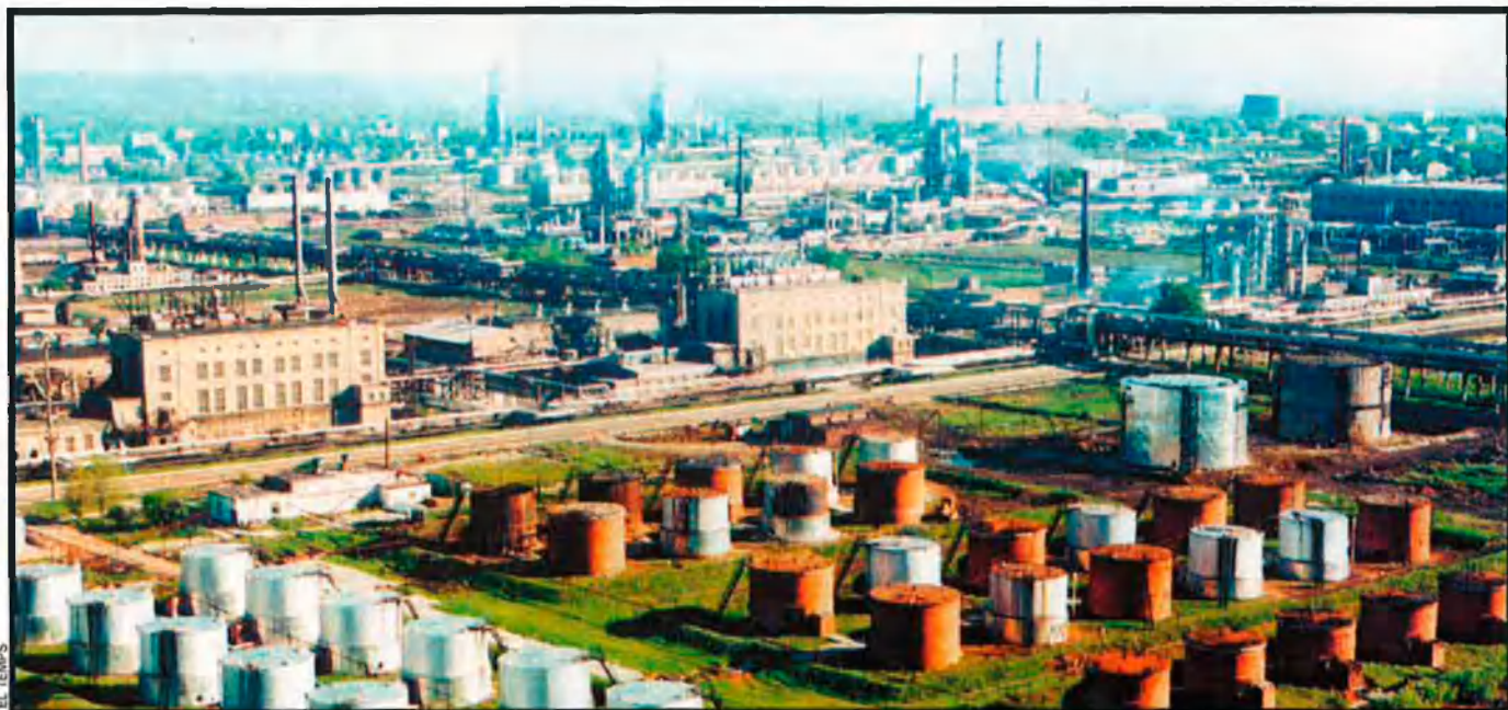
Mikhaïl Jodorkovski ha assentat la seua riquesa gràcies al negoci petrol·ler; de fet, està a punt de crear una de les grans empreses del sector al món. Paral·lelament ha posat en marxa un procés de creació de quadres polítics i plans socials amb els quals pensa reactivar Rússia.

de les necessitats petrol·lieres mundials. A més a més, a Rússia es troben més d'un trenta per cent de les reserves del gas mundial, cosa que interessa moltíssim als nord-americans.