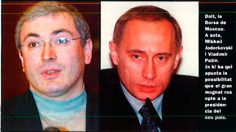
Dalt, la Borsa de Moscou. A sota, Mikhaïl Jodorovskii i Vladimir Putin. Ja hi ha qui apunta la possibilitat que el gran magnat rus opte a la presidència del seu país.