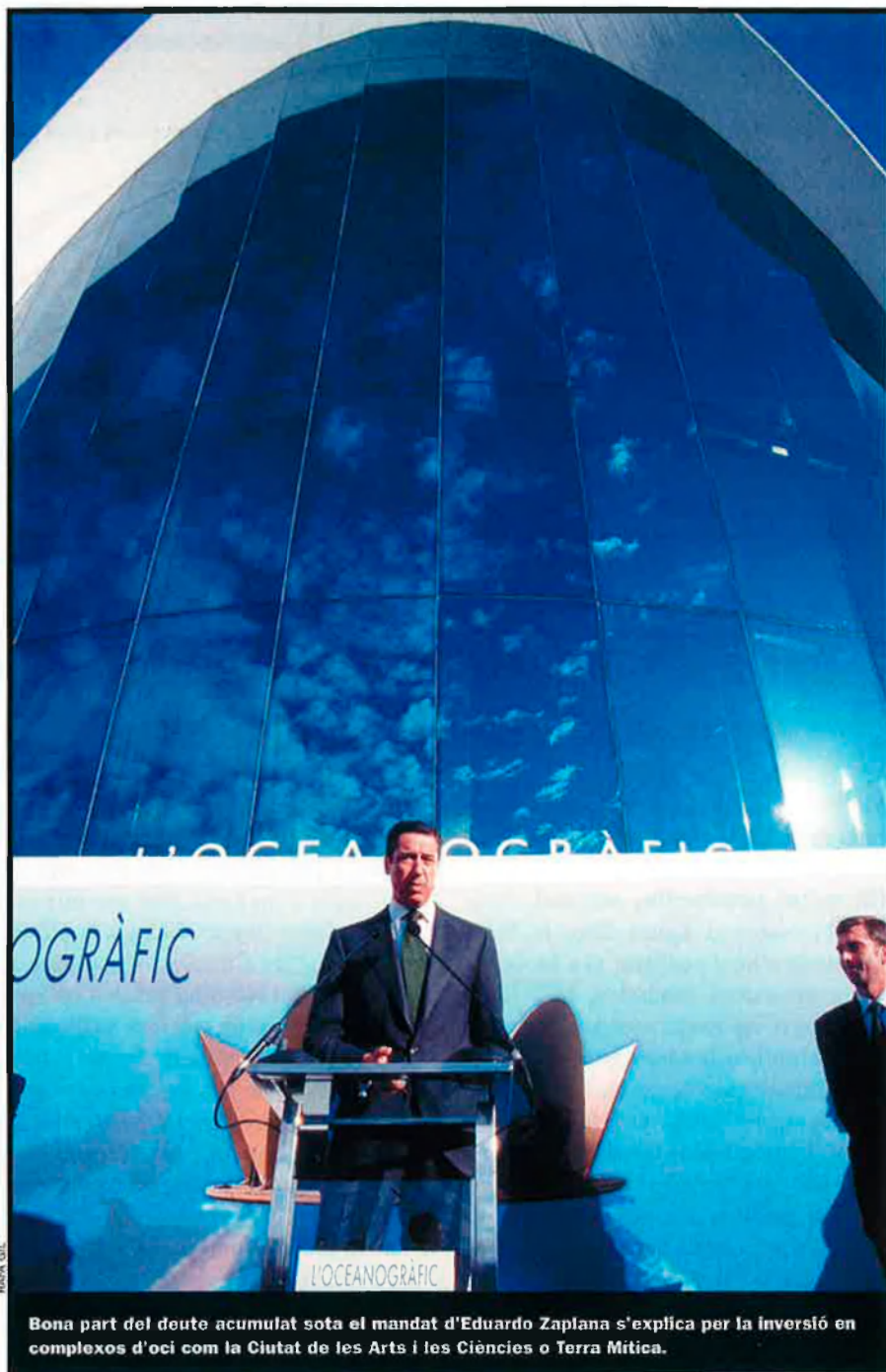
Bona part del deute acumulat sota el mandat d'Eduardo Zaplana s'explica per la inversió en complexos d'oci com la Ciutat de les Arts i les Ciències o Terra Mítica.

L'augment del deute és bo o dolent? Depèn. Des dels anys trenta del segle passat, molts governs han aplicat les recomanacions del prestigiós economista britànic John Maynard Keynes, les quals proposen d'endeutar-se en èpoques d'estancament o de recessió econòmica, perquè les administracions públiques, amb la seua inversió, actuen de locomotora de l'economia quan deixa de fer-ho el sector privat. Després, en les èpoques de creixement, hauran de tenir un superàvit que compense els deutes contrets en els temps de crisi. Des d'aquesta perspectiva, sobta l'espectacular hipoteca dels comptes valencians en vuit anys de creixement econò-