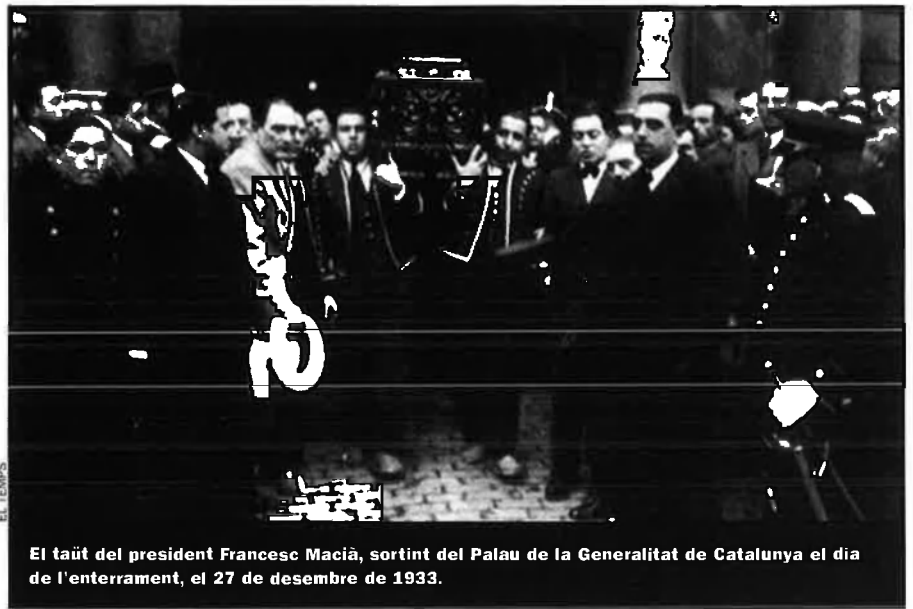
El taüt del president Francesc Macià, sortint del Palau de la Generalitat de Catalunya el dia de l'enterrament, el 27 de desembre de 1933.

El comunicat oficial de l'operació deia que es tractava d'un “procés apendicular antic” i que després de la intervenció