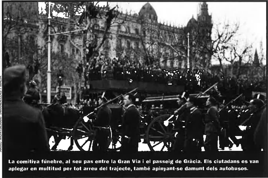
La comitiva fúnebre, al seu pas entre la Gran Via i el passeig de Gràcia. Els ciutadans es van aplegar en multitud per tot arreu del trajecte, també apinyant-se damunt dels autobusos.

Les botigues i les indústries van tancar, també els bancs i les administracions, es van suspendre les operacions borsàries i alguns teatres, com el Victòria, es van habilitar per hostatjar la gentada que volia assistir a l’enterrament. La cerimònia, de caràcter laic, tot i que Macià havia rebut els sants olis, va sortir del Palau, va recórrer la Rambla, on l’orquestra del Liceu interpretà “els Segadors”; després