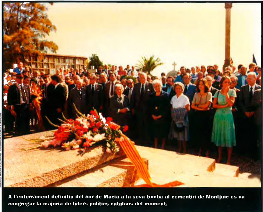
A l'enterrament definitiu del cor de Macià a la seva tomba al cementiri de Montjuïc es va congreguar la majoria de líders polítics catalans del moment.

D'aquesta manera es posà un aparent punt i final a la història de la mort de