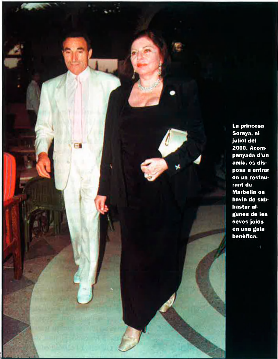
La princesa Soraya, al juliol del 2000. Acompanyada d'un amic, es disposa a entrar on un restaurant de Marbella on havia de subhastar algunes de les seves joies en una gala benèfica.