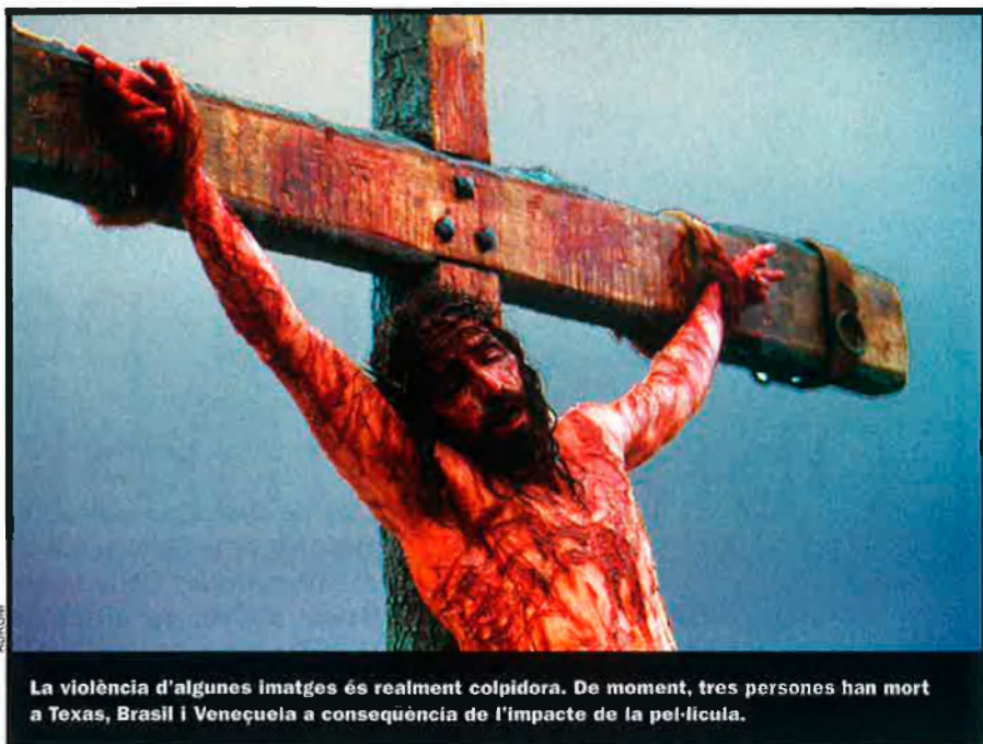
La violència d’algunes imatges és realment colpidora. De moment, tres persones han mort a Texas, Brasil i Veneçuela a conseqüència de l’impacte de la pel·lícula.