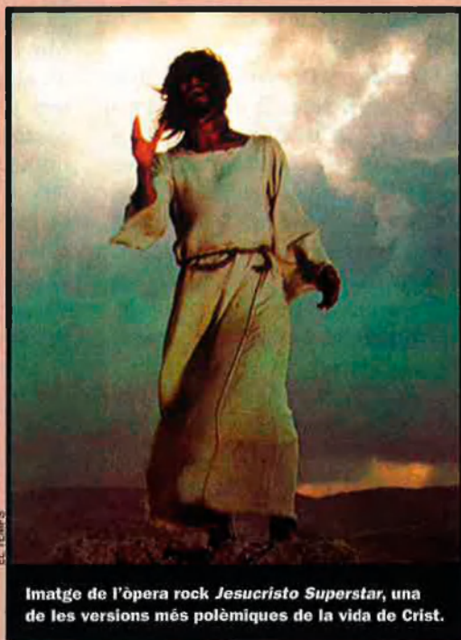
Imatge de l’òpera rock Jesucristo Superstar , una de les versions més polèmiques de la vida de Crist.

Amb tot aquest panorama, l’únic que alegra una mica la cartellera cinematogràfica –i l’esperit dels espectadors– és la reestrena de la mítica i genial pel·lícula La vida de Brian , dels anglesos Monty Python, basada en una sàtira de la vida de Jesucrist. Estrenada fa ja vint-i-cinc anys, sembla que pot ser l’únic antídote eficaç contra el fervor i la histèria provocada per Gibson.