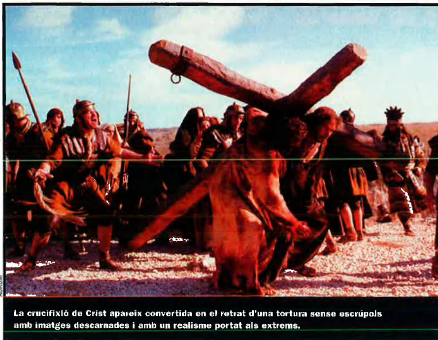
La crucifixió de Crist apareix convertida en el retrat d'una tortura sense escrúpols amb imatges descarnades i amb un realisme portat als extrems.

eren summament poderosos i no els interessava gens assumir els conceptes d'amor i germanor que predicava Jesús". De fet, tal i com assenyalen alguns experts, com s'entendria que el mateix poble que teòricament va matar Jesucrist Divendres Sant l'aclamés a la seua arribada a Jerusalem només uns dies abans, Diumenge de Rams?