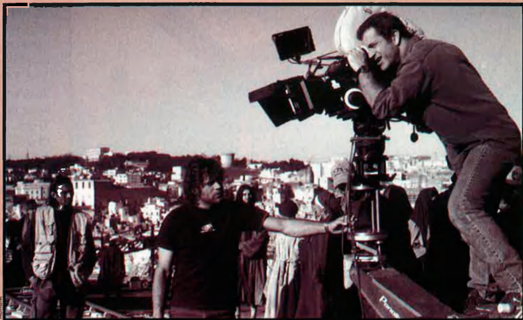
Gibson, en un moment del rodatge. L'actor i director forma part dels 100.000 ultracatòlics dels Estats Units i assistia a missa diària en llatí durant el rodatge a Itàlia acompanyat del protagonista, James Caviezel.

Ara, quan aquests episodis ja queden molt lluny, Gibson ha convertit La Passió de Crist en un dels "majors somnis" de la seua vida. Durant el rodatge de la pel·lícula, assistia a missa diària en llatí –tal com és habitual en els catòlics tradicionalistes–, als mateixos estudis de Cinecittà on es rodava el film. Gibson, però, no es trobava precisament sol en les seues