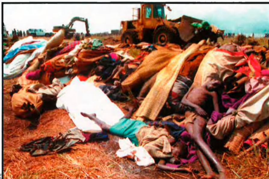
Els cossos amuntegats, producte del genocidi perpetrat arreu del país, eren recollits amb bulldozers.

Kofi Annan, aleshores cap de les operacions de les Nacions Unides, va demanar disculpes públicament. En un informe, els funcionaris reconeixien que no