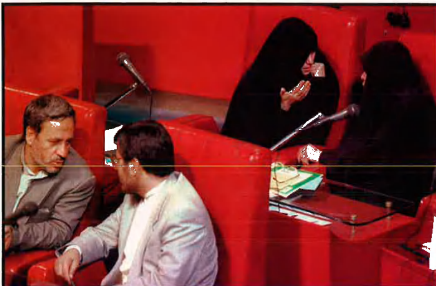
Al nou Parlament iranià els polítics conservadors marquen de nou la imatge. De les darreres eleccions, els reformistes en van sortir molt malparats i això ha desanimat els sectors socials més contestataris, com els joves i els estudiants.