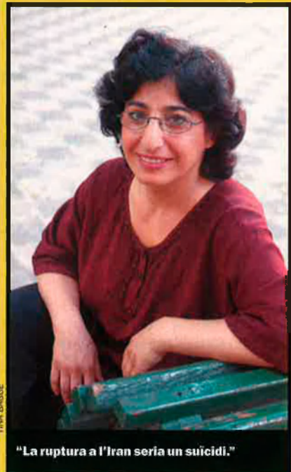
"La ruptura a l'Iran seria un suïcidi."

— Exacte. En van morir molts, com també hi va haver molt detinguts, alguns encara amb condemnes a mort per complir. Els reformistes que els havien d'ajudar al final van compartir de nou el poder amb els conservadors. D'alguna manera es van vendre. Els estudiants han criticat molt Khatami, que ha perdut tot el prestigi que tenia en aquesta part del poble i bona part de la resta. Això es va veure en les darreres eleccions, en que pràcticament van boicotar els reformistes, per això van guanyar els conservadors. Els estudiants ara han