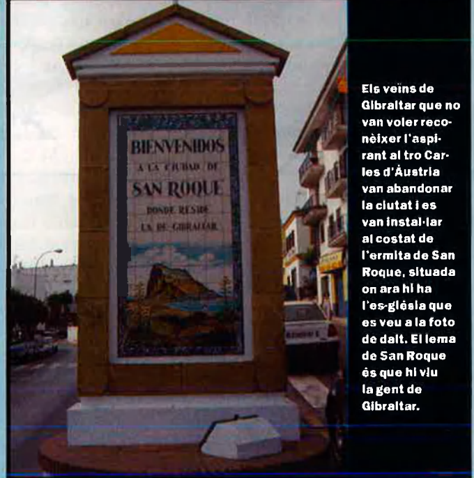
els veïns de Gibraltar que no van voler reconèixer l'aspirant al tro Carles d'Àustria van abandonar la ciutat i es van instal·lar al costat de l'ermita de San Roque, situada on ara hi ha l'església que es veu a la foto de dalt. El lema de San Roque és que hi viu la gent de Gibraltar.