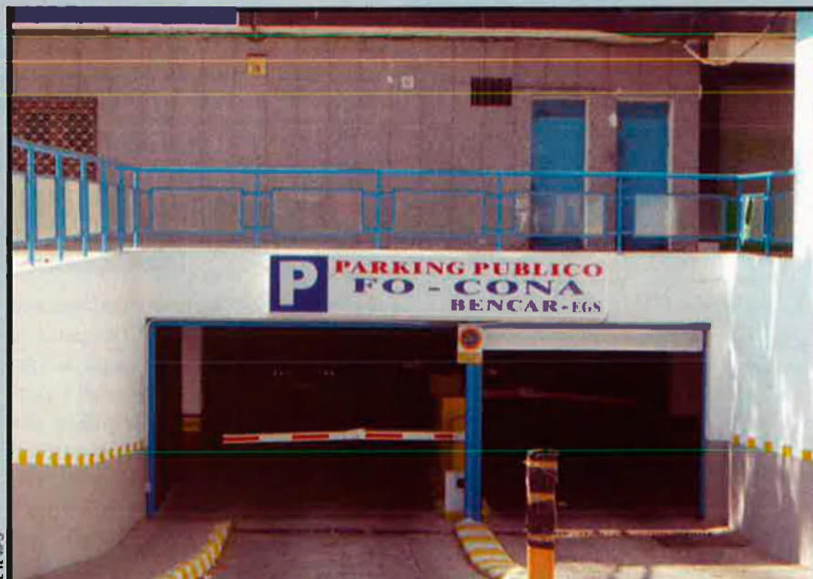
"Focona" (Four Corners, l'antiga frontera) és una de les moltes paraules que esquitxen el yanito , la parla característica de la ciutat.

dels estudis principals sobre la complexitat lingüística al penyal. A la tesi doctoral An Analysis of Code-switching in Gibraltar (1993), Moyer aclareix que el concepte de yanito no sols s'aplica com a gentilici i per parlar de l'alternança constant d'andalús i anglès, sinó també al mig miler de mots de substrat genovès, maltès, àrab i hebreu que conserven encara les generacions més grans. En l'origen i el manteniment del bilingüisme gibraltareny hi ha, d'una banda, l'ús familiar i ininterromput de l'andalús (malgrat que el component poblacional d'origen espanyol sempre ha estat minoritari en el conjunt del cens) i, d'una altra banda, l'evacuació de tots els civils durant la Segona Guerra Mundial en territoris anglòfons, la implantació a la segona meitat del segle XX del sistema educatiu