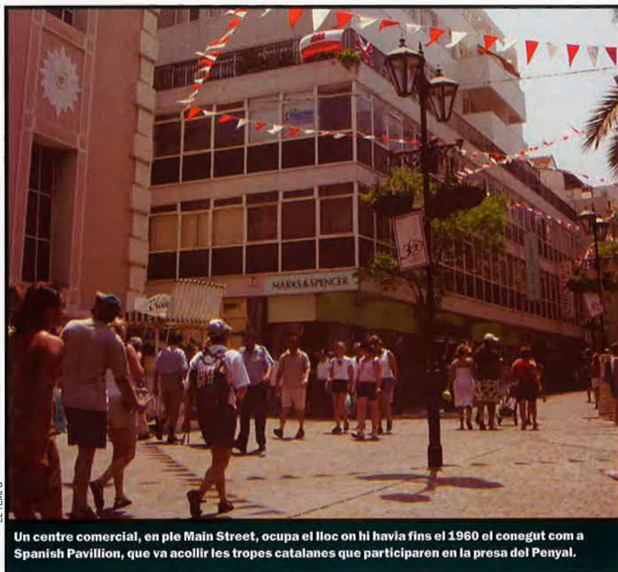
Un centre comercial, en ple Main Street, ocupa el lloc on hi havia fins el 1960 el conegut com a Spanish Pavillion, que va acollir les tropes catalanes que participaren en la presa del Penyal.

Un cas a part, però de capital importància en el primer segle d'ocupació britànica, el tindran els capellans de Maó i Ciutadella cridats expressament pels governadors anglesos per assistir la gran majoria de fidels catòlics (genovesos, menorquins, portuguesos, espanyols i maltesos). Des de la mort dels pares Juan Romero de Figueroa i José López de Pena, els dos únics religiosos que s'havien quedat a la fortalesa després de l'entrada de les forces de la Gran Aliança el 1704, i en paral·lel a les peticions al