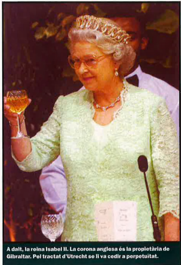
A dalt, la reina Isabel II. La corona anglesa és la propietària de Gibraltar. Pel tractat d'Utrecht se li va cedir a perpetuïtat.

pogueren i es posaren fins i tot en perill personal per fer respectar la religió i la vida" dels pocs pobladors que restaven a la vila. Una actitud, val a dir, que va molestar Rooke i la resta de comandaments militars anglesos a la plaça, i que ja de bon començament va encendre discòrdies entre el representant de Carles III al "territori alliberat" de Gibraltar i els de la reina Anna d'Anglaterra. La decisió del príncep Jordi de designar governador militar un coronel catòlic irlandès, Henry Nugent, va afegir sens dubte més llenya al foc. Però les desavinences entre els aliats es van manifestar, clarament, amb la visió que tenien de la potencialitat de Gibraltar, ja contraposada des del mateix consell de guerra que es va reunir el 28 de juliol de 1704 a bord del Ro-