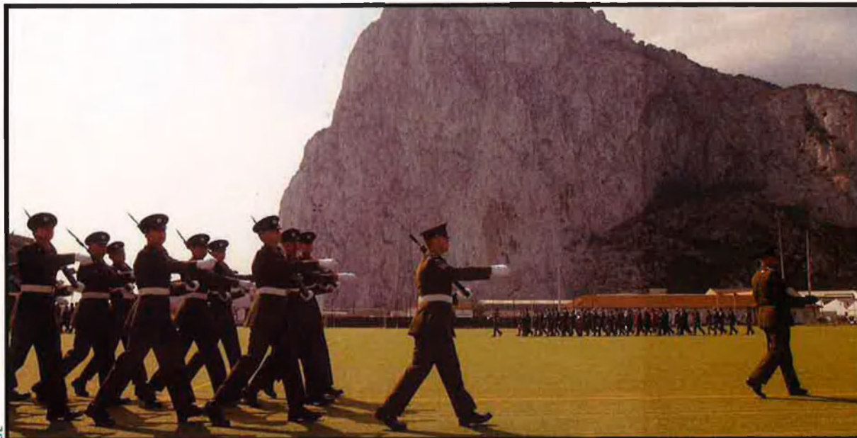
Els enginyers reials de l'Armada Britànica en un dels actes de celebració del 300è aniversari de la sobrania britànica de Gibraltar.