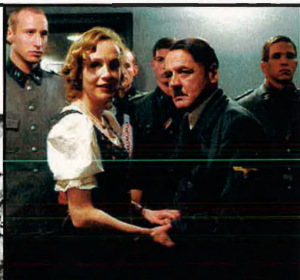
Més paral·lelismes extraordinaris. La parella Hitler-Braun està molt ben caracteritzada, però, en canvi, alguna de les escasses celebracions que va acollir el búnquer potser han estat una mica exagerades al film.

Eva Braun, que fins aleshores havia estat separada de Hitler, s'havia mudat pocs dies abans al búnquer. Aviat escrivia a una amiga: "Ja sentim com tronen els canons del front. Com pot imaginar, dormim terriblement poc. Però sóc tan feliç, sobretot perquè ara sóc prop seu."