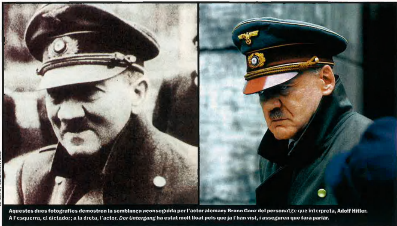
Aquestes dues fotografies demostren la semblança aconseguida per l'actor alemany Bruno Ganz del personatge que interpreta, Adolf Hitler. A l'esquerra, el dictador; a la dreta, l'actor. Der Untergang ha estat molt lloat pels que ja l'han vist, i asseguren que farà parlar.