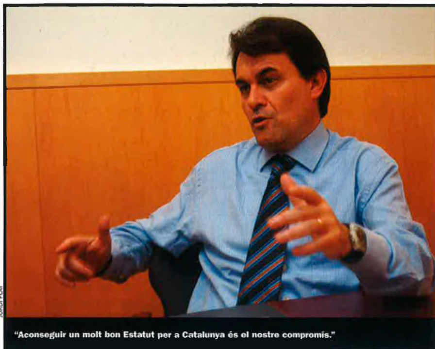
"Aconseguir un molt bon Estatut per a Catalunya és el nostre compromís."

Si el model està a l'Estatut, sigui quin sigui el Govern a Madrid, ens podran tocar els càlculs, però no el model.